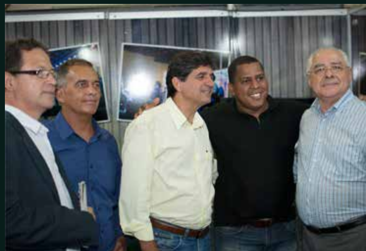
Visita ao estande de Mucugê. O Prefeito montou o estande na Feira de Economia Solidária com o propósito de vender a idéia de: “Mucugê, um paraíso ecológico pertinho de você”.