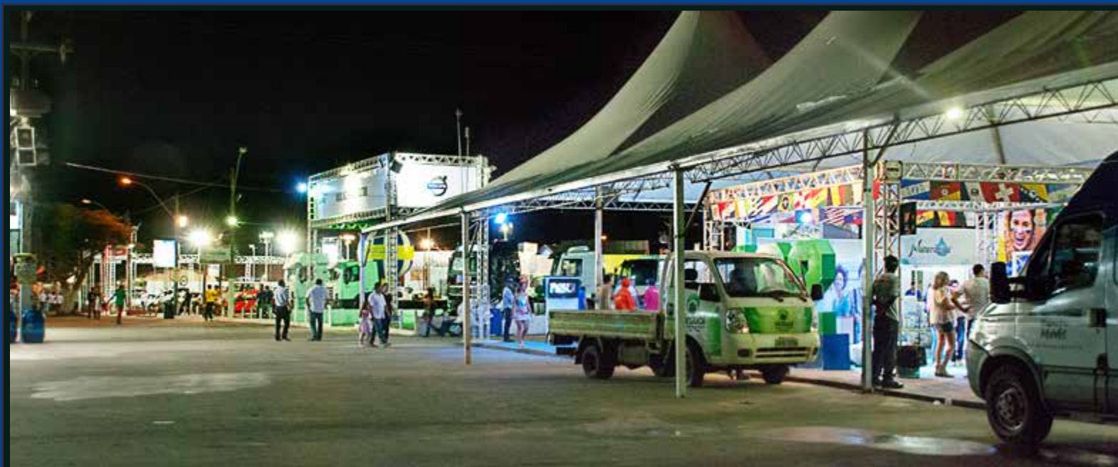
Tenda da Associação da Economia Solidária